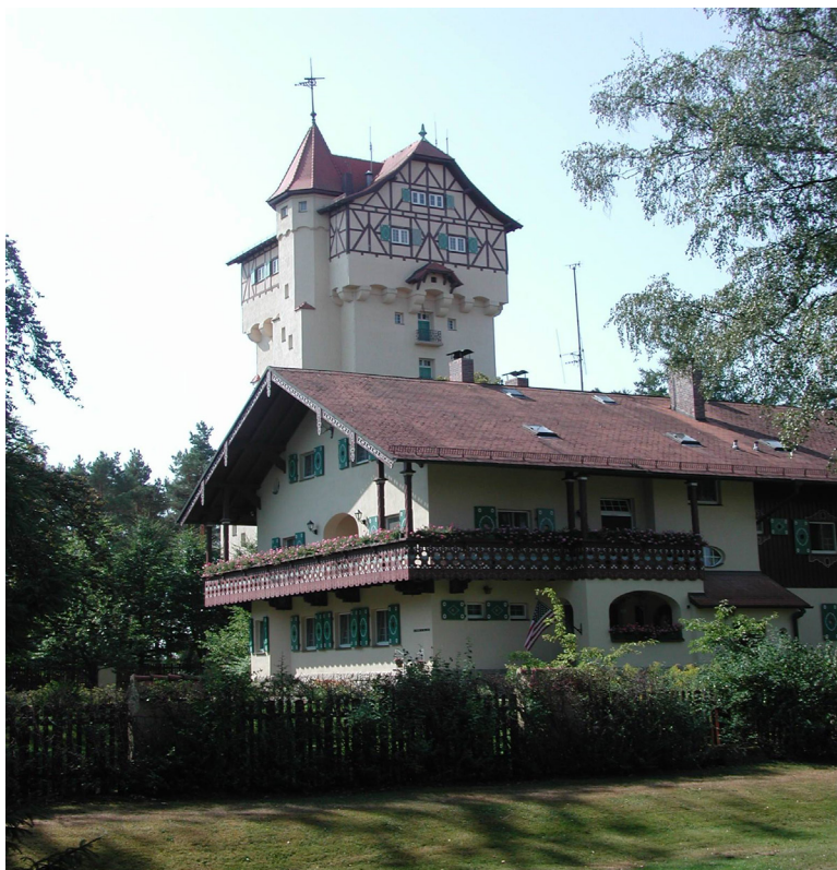
Altes Forsthaus mit Wasserturm